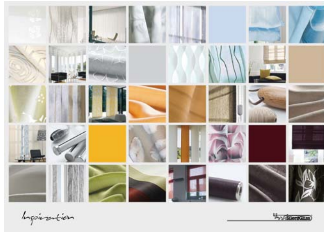
Een poster om te inspireren.